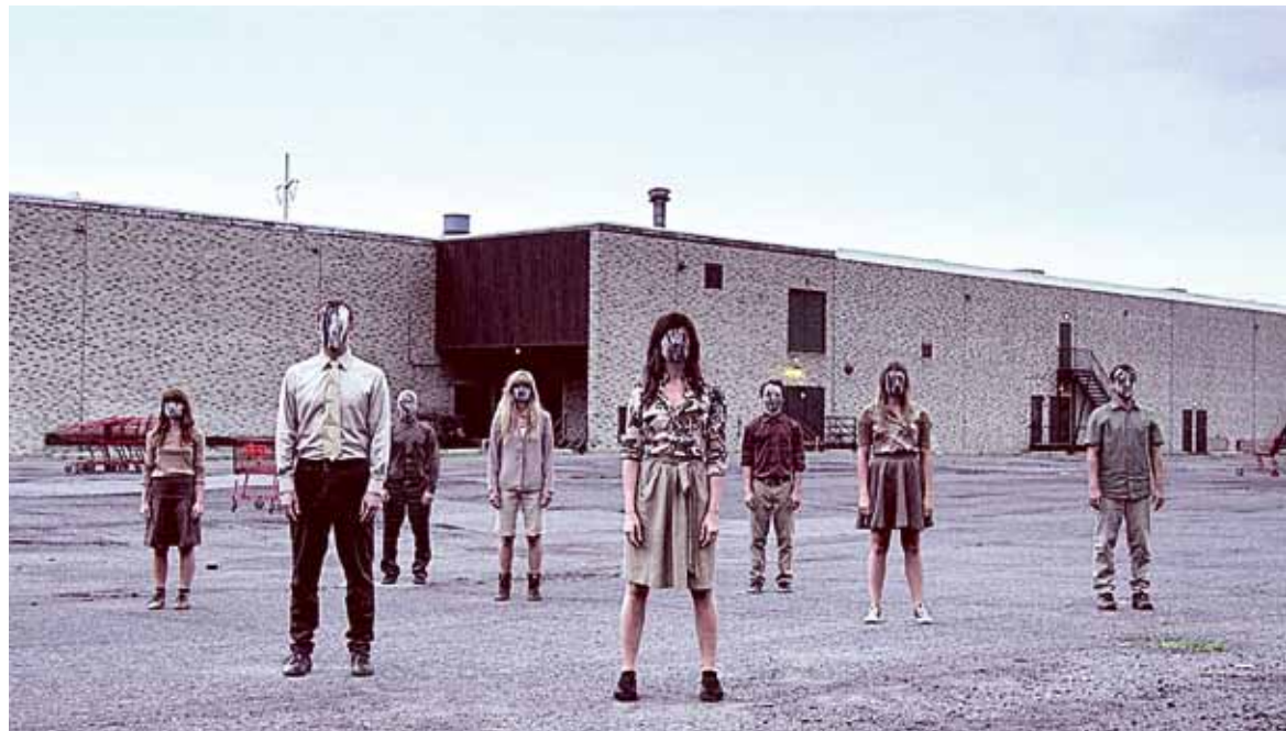
Avec l'aimable permission de Arcade Fire

Parmi les réalisations sélectionnées, Sprawl II — que l'on peut déjà expérimenter sur le site www.sprawl2.com/ — sera présentée dans sa version linéaire, mais aussi dans sa version interactive, sous la forme d'une action performative filmée par le réalisateur.