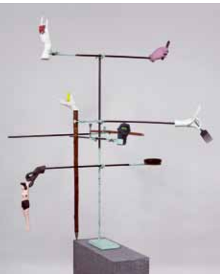
Cargo-culte , 2011 Statif en métal et objets en bois, rotin, métal, plastique et céramique, plâtre Hydrocal FGR, acrylique, peinture émail 154,5 × 122 × 127 cm Collection du Musée d'art contemporain de Montréal