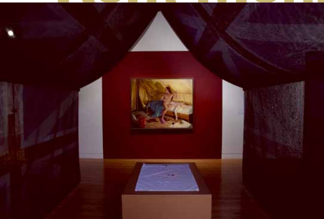
The Night of September 12, 1759 , 2011 2 acryliques sur toile, 2 moustiquaires peintes, strass, tiges en bois, 2 taies d'oreiller avec monogramme brodé et empreinte (monotype), son Dimensions variables Don anonyme en l'honneur de monsieur W. Bruce C. Bailey Collection du Musée d'art contemporain de Montréal