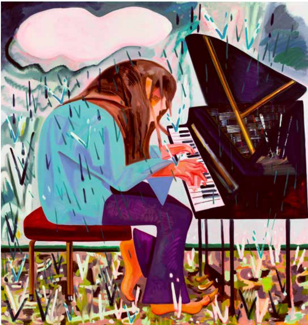
Piano in the Rain , 2012 Huile sur toile 223,5 × 213,4 cm Collection particulière, New York